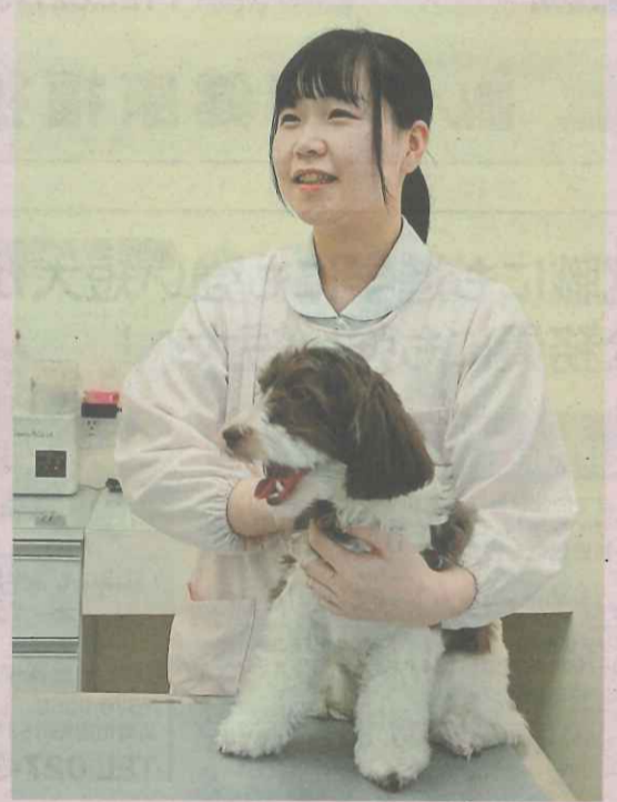
桑原動物病院(前橋市)